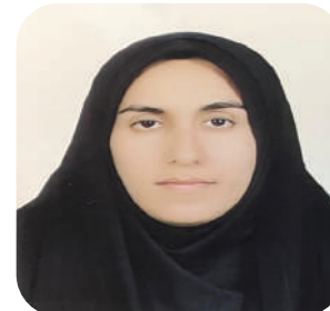
مریم امیری سرگاوئی قائم مقام معاونت جوانان، نوجوانان و نخبگان