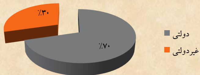
بر اساس نوع مدرسه