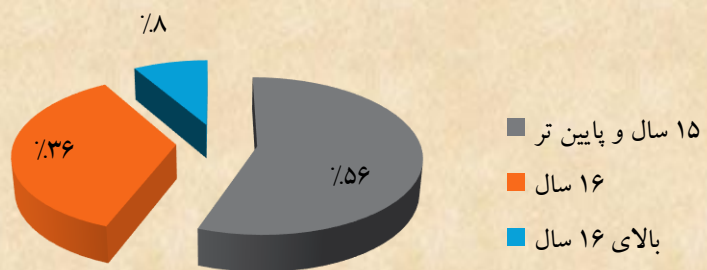
بر اساس گروه سنی