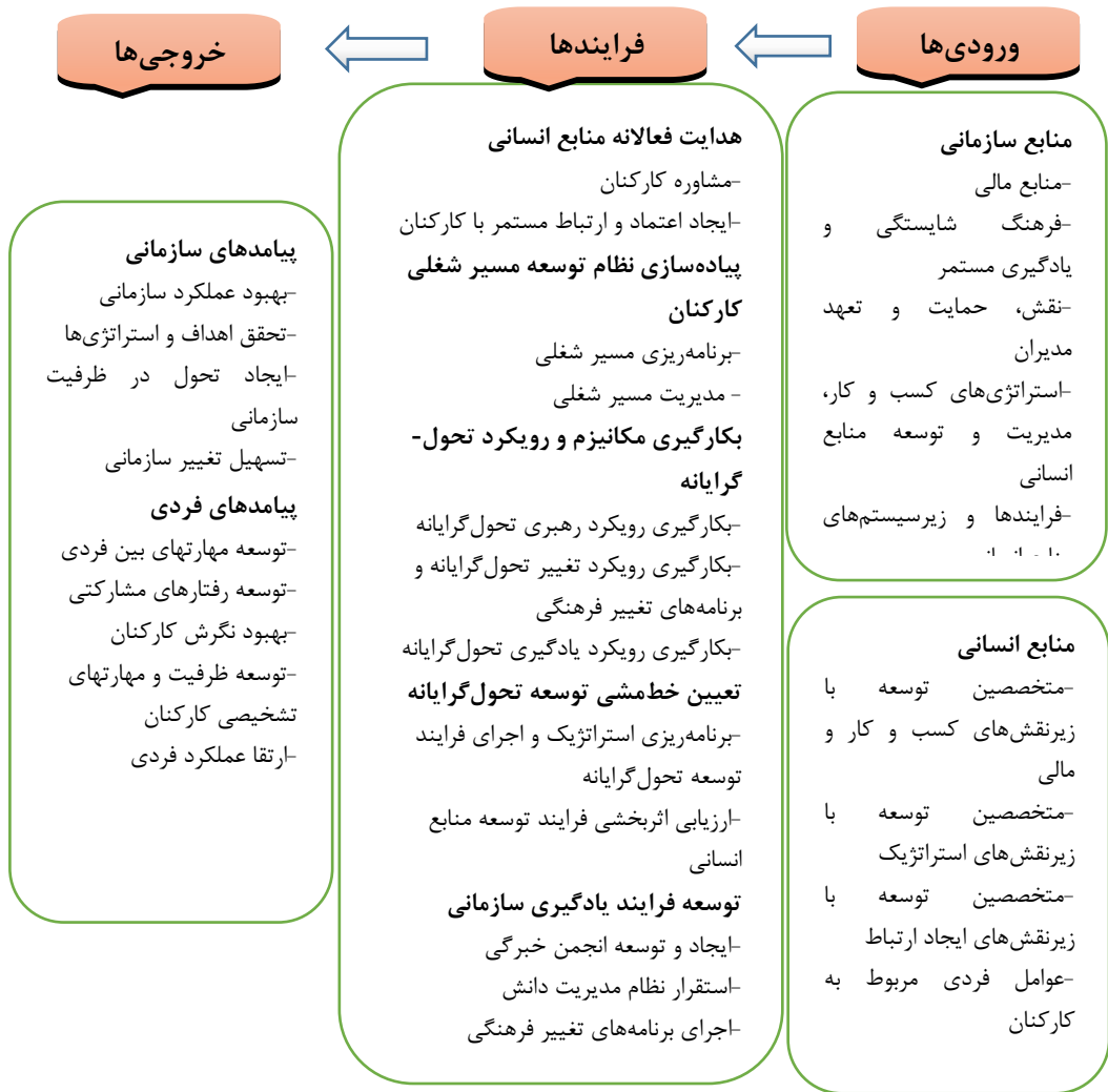
شکل شماره (۳) مدل توسعه منابع انسانی مبتنی بر رویکرد تحول‌گرایانه