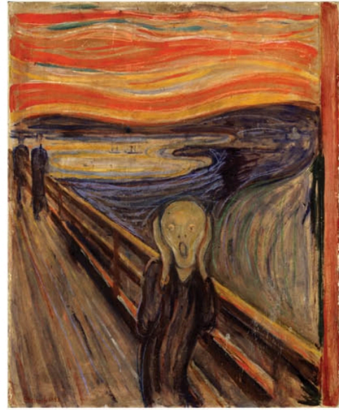
فخرمند: ادوارد مونک سال: ۱۸۹۳

گونه: نقاشی رنگ روغن، چسب رنگ، باستان و مباد شمعی بر روی مقوا ابعاد: ۹۱ سانتی متر x ۷۳.۵ سانتی متر مکان: گالری ملی / اسلو / نروژ