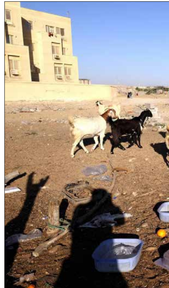
پایگاه خبری وزارت راه و شهرسازی NEWS.MRUD.IR

پیشنهاد مربوط به تعیین تکلیف زمین‌های جنگلک در داخل شهر چابهار به کمیته راهبری ارایه شده است. جنگلک یکی از ۱۲ سکونتگاه غیررسمی است که در داخل شهر شناسایی شده‌اند. بقیه سکونتگاه‌ها نیز در سطح شهر و در کاربری‌های مختلف پراکنده هستند. بعضی‌ها مانند جنگلک در کاربری‌های اداری شکل گرفته‌اند. برخی در کاربری فضای سبز، در مسیل کانال‌ها، در معابر و برخی در کاربری‌های مسکونی هستند. سکونتگاهی که در کاربری‌های مسکونی هستند، قابلیت درج‌سازی دارند و باید در این چارچوب ساماندهی و توانمندسازی شوند. درج‌سازی این سکونتگاه‌ها، دستور کار برنامه مشترک