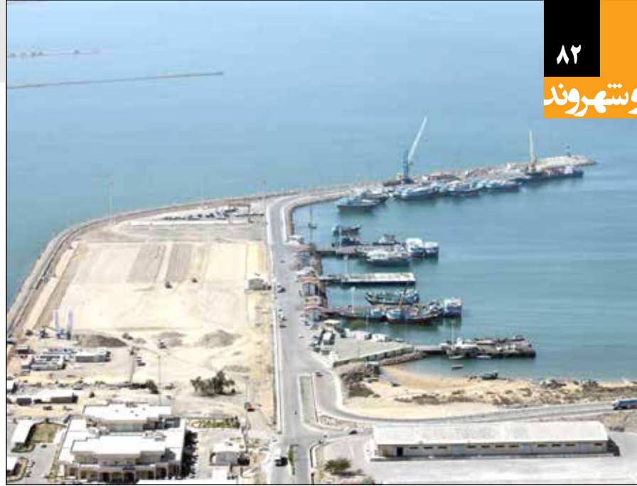
سفیر جمهوری اسلامی ایران در دهلی نو: