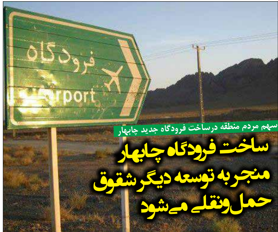
سه‌م مردم منطقه در ساخت فرودگاه جدید چابهار

ضرورت دارد بخاطر ساکنان آن منطقه فرودگاه حتما ساخته شود. ضمن آنکه اصلاً منطقه آزاد بدون فرودگاه نمی‌شود. به دلیل فاصله فرودگاه کنارک از منطقه آزاد