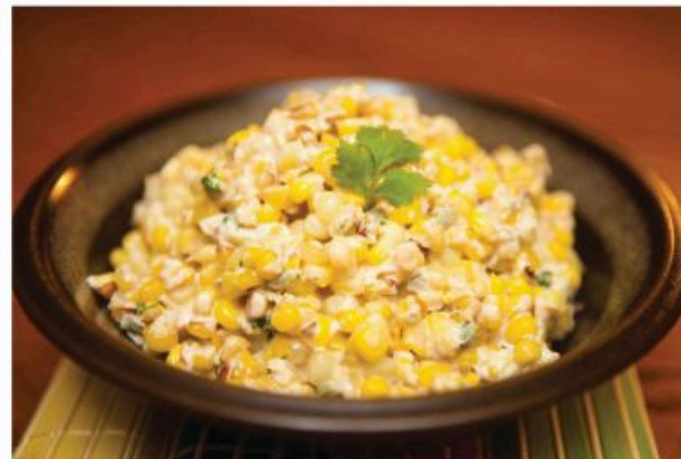
طرز تهیه ذرت مکزیکی

قارچ رو به شکل ورقه های نازک خرد کنید و در مقدار خیلی کمی روغن تفت بدید. قارچ رو به مقداری که به مزاجتون خوش میاد بپزید به طور کلی به اندازه پنج دقیقه تفت برای قارچ کافیه. ولی اگر جزو اونایی هستید که از قارچ های نیم پز و آبدار خوشتون نمیاد، میتونید بیشتر بذارید تا به اندازه دلخواهتون پخته بشه. پودر خردل و آویشن رو هم در این مرحله اضافه میکنیم