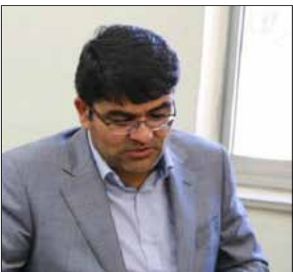
مدیرعامل هلال احمر استان: