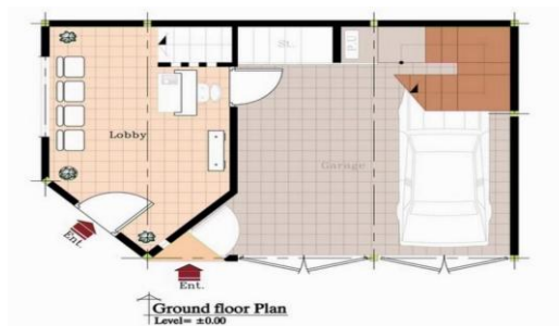
Ground floor Plan Level = ±0.00

شکل 9: پلان زیرزمین