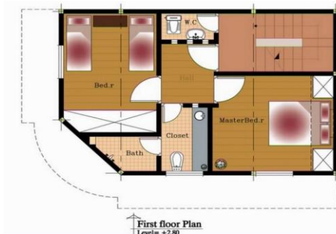
First floor Plan Level = +2.80

شکل 11: پلان طبقه اول