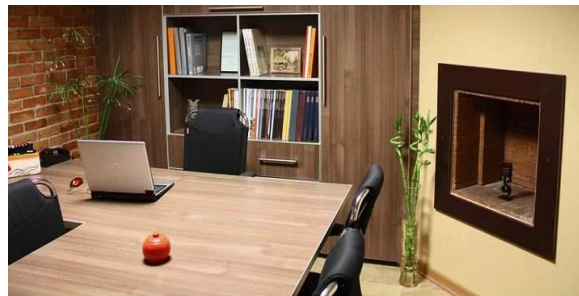
شکل 8: دفتر معمار