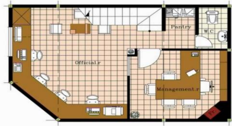
Basement Plan Level = -2.50

شکل 9: پلان زیرزمین