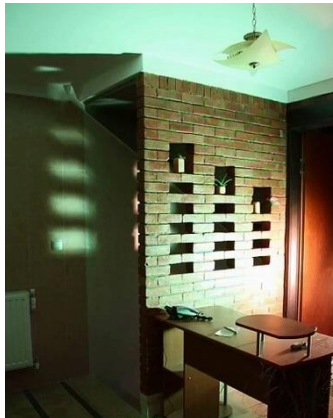
شکل 7: ورودی (لابی)