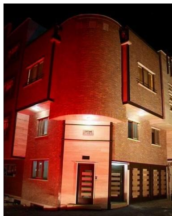
شکل 5: نمای ساختمان