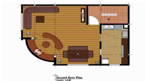
Second floor Plan Level = +0.00

شکل 10: پلان همکف