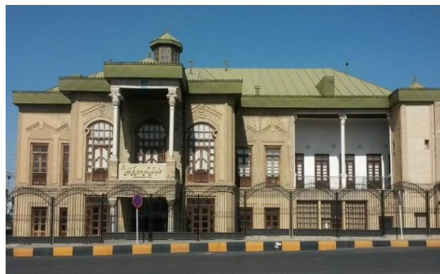
شکل 1: سر درب و ورودی خانه و نمای اصلی