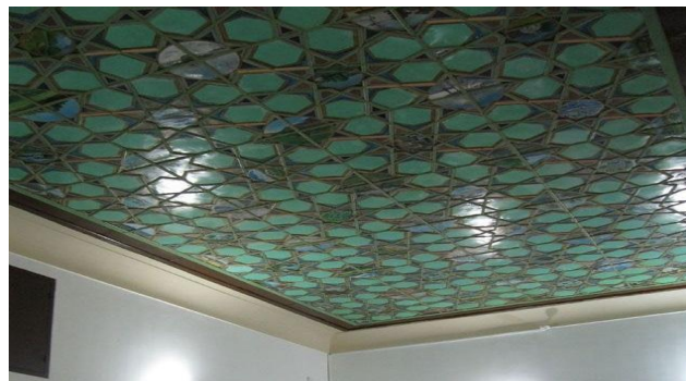
شکل 2: تزئینات سقف