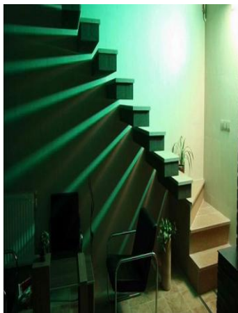
شکل 6: راه پله دفتر طراحی