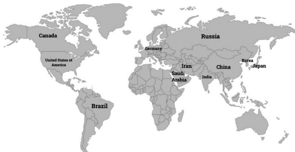
شکل ۱- موقعیت جغرافیایی کشورهای مورد مطالعه Fig. 1- Geographical location of the studied countries

مطابق با آخرین آمار و اطلاعات گزارش شده توسط IEA در سال ۲۰۱۷، کشورهای چین، ایالات متحده آمریکا، هند، روسیه، ژاپن، آلمان، ایران، عربستان سعودی، کره،