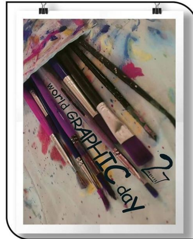
پوستر روز جهانی گرافیک

بسیاری از نوجوانان، فست‌فودها و دگرگونی‌های ژنتیکی در این صنعت تجربه می‌کنند. آنها نباید از راه اصلی عبود دور شوند و نباید تغییرات مضر هدف اصلی او شود. نوجوانان سالم، پوسن از هر عملی خوب فکر می‌کنند و در ایجاد آن کار تنها از احساساتش پیروی نمی‌کنند، یعنی عقل خود را فدای احساس نمی‌کنند.