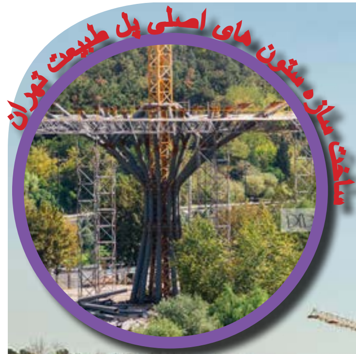
سازه ستون های اصلی پل طبیعت تهران