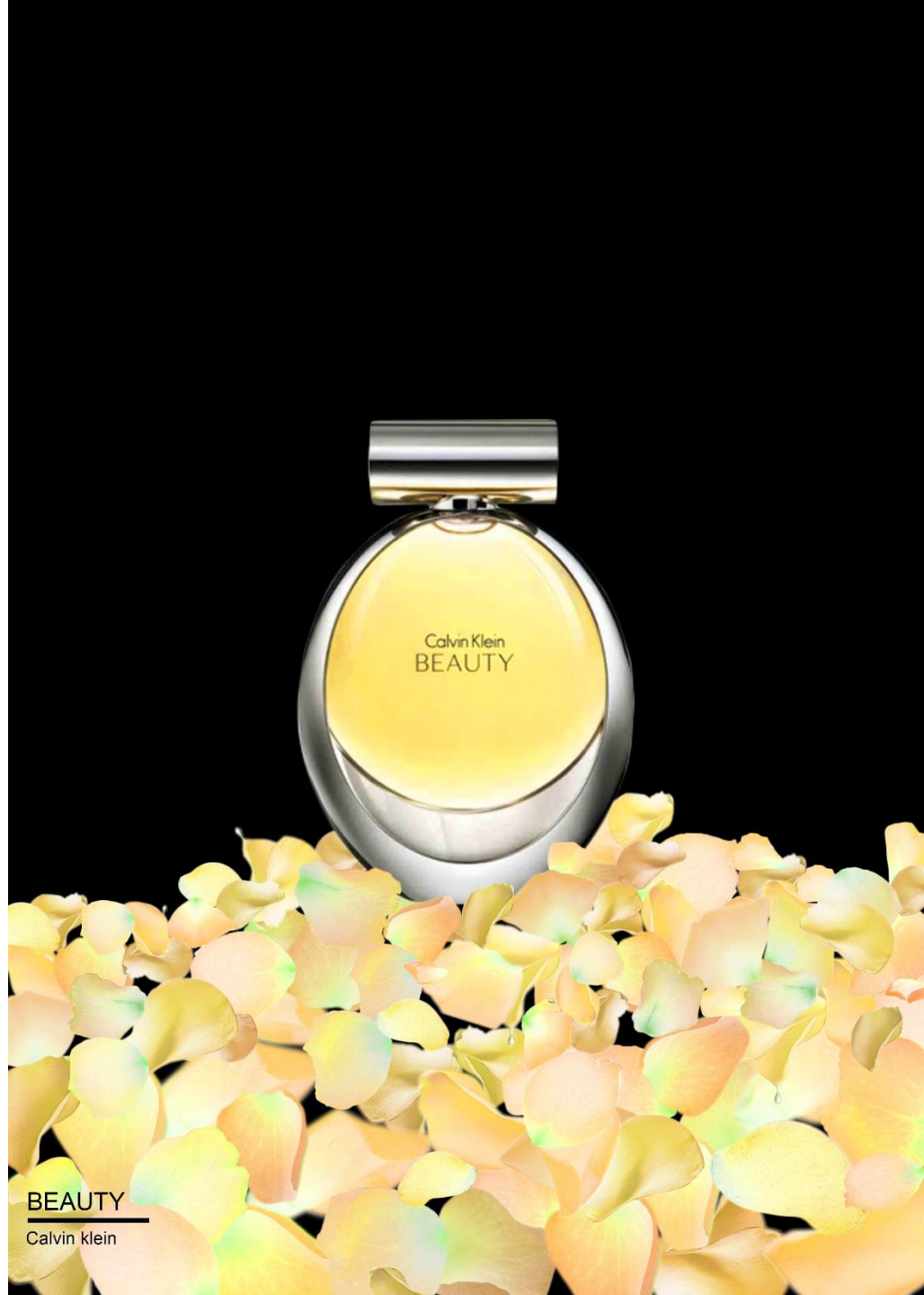
BEAUTY Calvin Klein