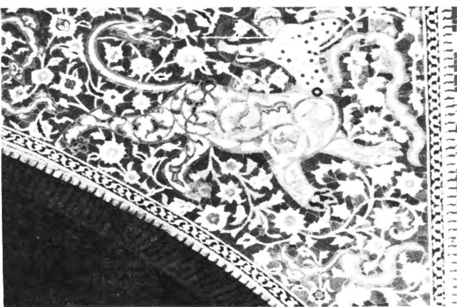
کاشیکاری سردرِ قیصریه با تصویر برج قوس (طالع اصفهان)