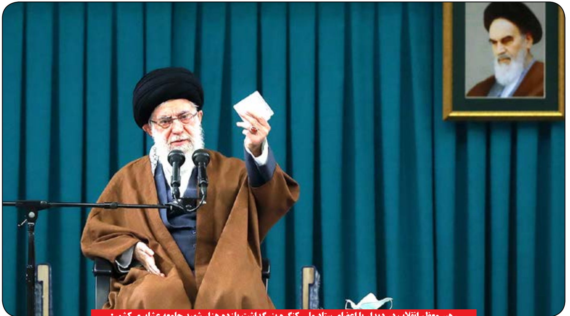
رهبر معظم انقلاب در دیدار با اعضای ستاد ملی کنگره بزرگداشت یازده هزار شهید جامعه عشایری کشور:

شهدای عشایر، شهدای شما، این یازده هزار شهید هم تاثیر دینی را نشان می دهد. بهتر است بواسطه این کنگره عشایر را معرفی کنیم. ایشان با تاکید بر ضرورت کار فرهنگی در مناطق عشایری کشور، فرمودند: