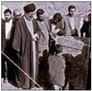
مقام معظم رهبری: عشایر ما، مردمانی صادق و بااخلاص و راستگو و شجاع هستند