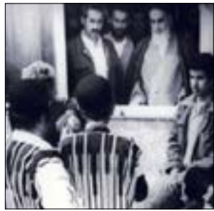
امام خمینی (ره): شما عشایر پشتوانه این مملکت بودید و هستید انشاء الله