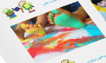
برگزاری دور های آموزشی سوزنی و کودک و ابردهای جمعی برای آشنایی بیشتر