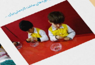
برگزاری دور های آموزشی سوزنی و کودک و ابردهای جمعی برای آشنایی بیشتر