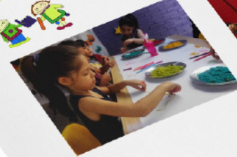
برگزاری دور های آموزشی سوزنی و کودک و ابردهای جمعی برای آشنایی بیشتر