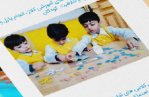
برگزاری دور های آموزشی سوزنی و کودک و ابردهای جمعی برای آشنایی بیشتر