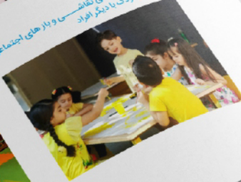
برگزاری دور های آموزشی سوزنی و کودک و ابردهای جمعی برای آشنایی بیشتر