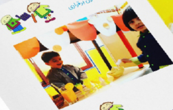
برگزاری دور های آموزشی سوزنی و کودک و ابردهای جمعی برای آشنایی بیشتر