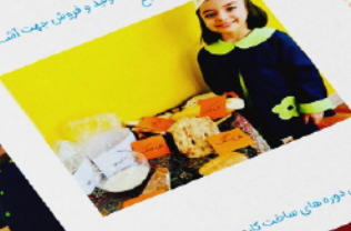
برگزاری دور های آموزشی سوزنی و کودک و ابردهای جمعی برای آشنایی بیشتر