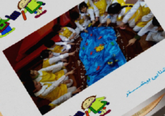
برگزاری دور های آموزشی سوزنی و کودک و ابردهای جمعی برای آشنایی بیشتر