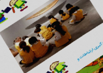
برگزاری دوره های نقاشی و بار های اجتماعی گروهی برای یادگیری ارتباطات و تعامل کودک با دیگر افراد