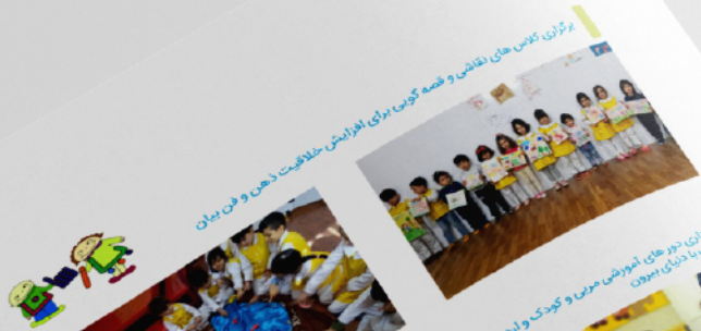
برگزاری نمایش های نقاشی و قلمه گویی برای افزایش خلاقیت ذهنی و فن بیان