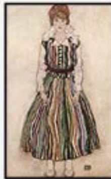
عنوان Portrait der Edith Schiele im gestreiften Kleid رنگ گواش و مداد اندازه 80 * 180