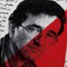
معدای زمان و کلمه ریاضت

تقاطع ارواح: شعر هرگز از میان نخواهد رفت، بلکه قدرت برتری گشتن را در این با افرای