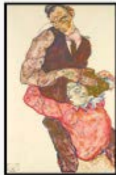
عنوان Lover رنگ گواش و مداد اندازه 25 * 42

سلف پرتره این هنرمند ستی است که به دوران رنسانس و ون ایک، دورور و استاد بزرگ فرم، رامبراند برمی گردد. شیله هنوز تنها ۲۲ سال داشت که خودش را با Physalis نقاشی کرد، اما سبک او در این کار معمایی کاملاً پخته است. این نگاه نافذ به سمت بیتتده، ابروهای قوس دار، لبها جمع شده، سر به یک طرف خمیده، نشانگر غرور، حتی تکبر، جوانی است که از استعدادهای خلاق بی نظیر خود آگاه است. او شاید کمی با بقیه مخالف باشد، در جامعه معمولی و با قوانین و اخلاق ناپسندش، از او جدا شده است. و در یک طرف آن میوه درخشان ماریج قرار دارد، شاخه های حلقوی آن باعث ایجاد تضاد کامل با توده های سیاه می شود که مو و کت شیله را تشکیل می دهد.