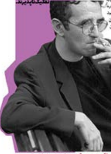
برای هر کس که در این روزگار با یک روح در میان باشد...

بنا کردن خانهای مستحکم بر لبه نبح زمان زمان از دیدگاه عقل نظری ناب چسبیده نیست مگر گشتندی از دسترفته آینههای نشسته و جانی بدون اشتداد آگوستین لویفاج لچارب روانی بشر، یعنی خاطره و فرازگ و پیش‌بینی را بنیان پدیدارشناسی زمان حال می‌داند. آگوستین معتقد بود که گذشته و آینده از طریق خاطره و انتظار به حال بدل می‌شوند. او به‌رغم آگاهی فلسفی از نشی زمان در شکل‌های به ندرستی زبانی، مفهوم نفس منته را در مرکز نظریه خویش در باب زمان قرار می‌دهد و اشتداد نفس در گذشته و آینده را یکنانه راه‌حل مسای زمان می‌داند. تفسیر مسیحی آگوستین مبتنی بر رابطه‌ای دین و فردی بنا خوانده و جهان است که نماینی چون گناه، رهنمود فلسفی، محبت، امید، رستگاری، رنج و بسیاری مفاهیم اخلاقی و روانشناختی دیگر محتوای حقیقی آن را تشکیل می‌دهند. توجه به غنایت زبانی ندرستی بشری، این تفسیر از ماهیت فردی و دینوشی فارغ نیست. نحوه درک زمان را همیشه دگرگون ساختن بدل رنگبوی این مسیر را به‌طور شری دیگر اندیشه می‌دهد. رابطه‌ای میان‌بخشی زمان با نفس، رنگبوی معتقد است تفکر تاریخی همواره از حل مسای زمان عاجز خواهد ماند. فلسفه و علوم هرگز بر زمان مانده