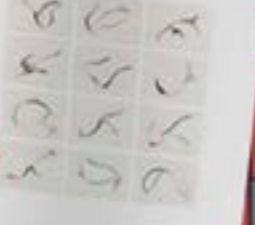
فرزنامه به‌منابه ونهیت ذهنی و زیستی

فرزنامه: تقاطع ارواحی برایشکافی متجدد است با نگرش خود را با قرب مسیحی وادار می‌داند.