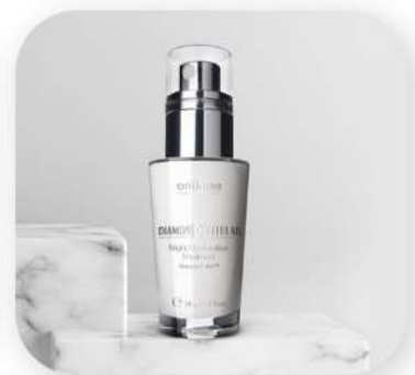
کرم مخصوص شب اوریفلیم