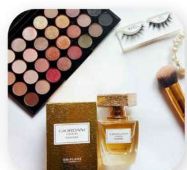
پالت سایه 48 رنگ اوریفلیم