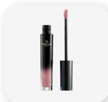
رژ لب مایع 24 ساعته اوریفلیم