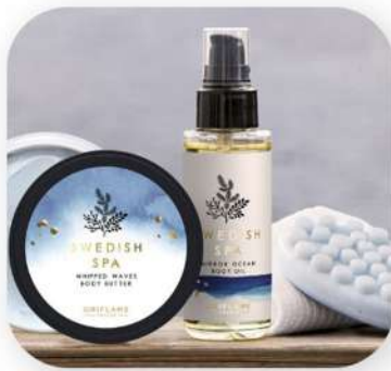
لوسیون بدن اوریفلیم