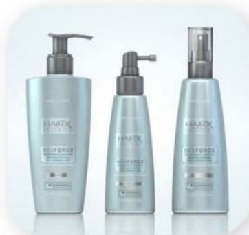
ست آب رسان و سرم اوریفلیم