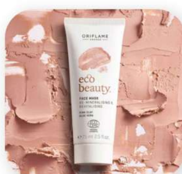
ضدافتاب رنگب اوریفلیم