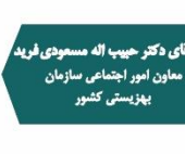
آقای دکتر حبیب‌الله مسعودی فرید معاون امور اجتماعی سازمان بهزیستی کشور