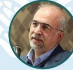
آقای دکتر احمد حاجبی مدیر کل دفتر سلامت روانی-اجتماعی وزارت بهداشت، درمان و آموزش پزشکی