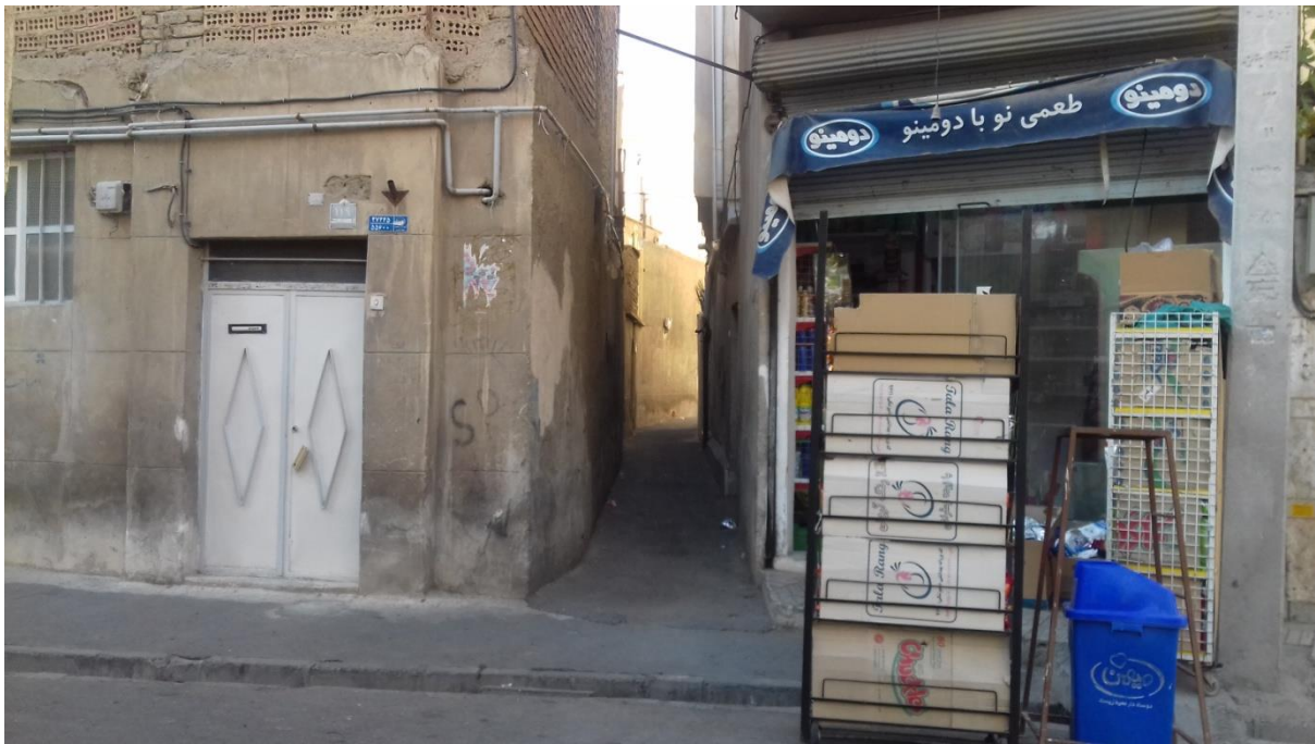
تصویر شماره 4: عدم وجود روشنایی در کوچه های تنگ و باریک