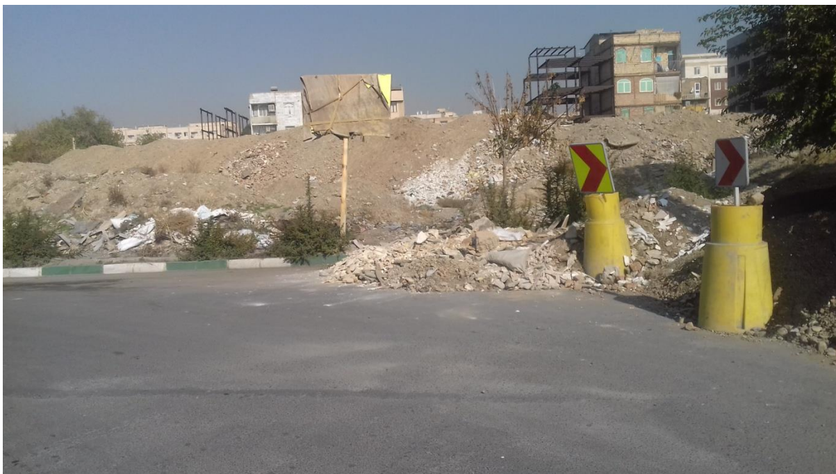
تصویر شماره 2: رهاشدگی چندین ساله‌ی احداث محور بروجردی