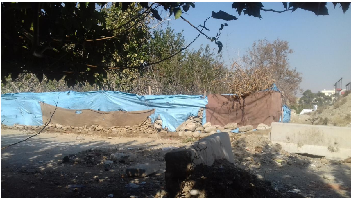
تصویر شماره 1: وجود زمینهای بایر و رها شده بدون دیوارکشی (محل تجمع جوانان برای خوردن مشروبات الکلی در ساعات پایانی روز)

محلّه شادآباد و سعیدآباد کم رنگ گردد. همچنین پروژه در دست اجرا بزرگراه بروجردی در شمال بافت محلّه شادآباد باعث فاصله گرفتن محلّه شادآباد با محلّه هفده شهریور شده و پیوستگی کالبدی و اجتماعی میان دو محلّه را از بین برد. همچنین وجود کاربری های غیر مسکونی درشت دانه نظیر پارکینگ نیرو و انتظامی، زمین های کشاورزی و بایر جنوب بافت محلّه باعث گردیده محلّه شادآباد از ارتباط و پیوستگی اجتماعی با محلّه یافت آباد شمالی برخوردار نباشد. در این میان خیابانهای شرقی محلّه شادآباد نظیر جعفری و علیپور دارای پیوستگی کالبدی و اجتماعی با محلّه شمس آباد می باشد