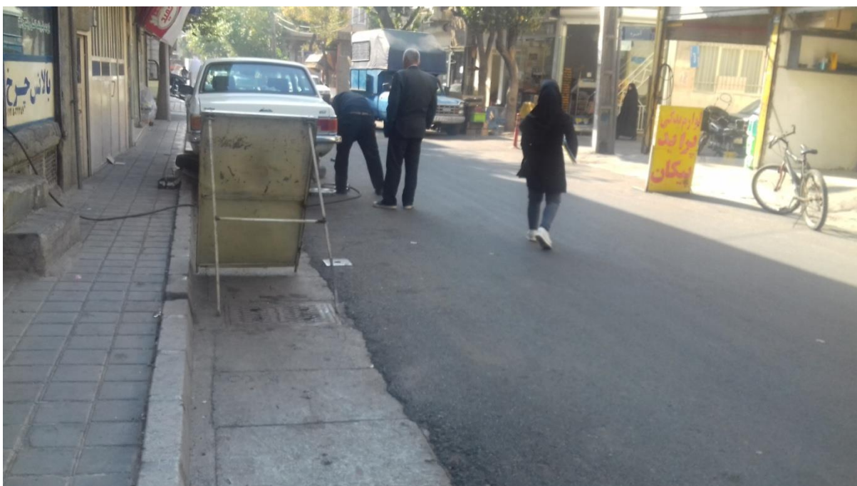
تصویر شماره 3: مشکلات کالبدی معابر و خیابانهای محله شاد آباد (عدم مناسب سازی شهری برای معلولین)