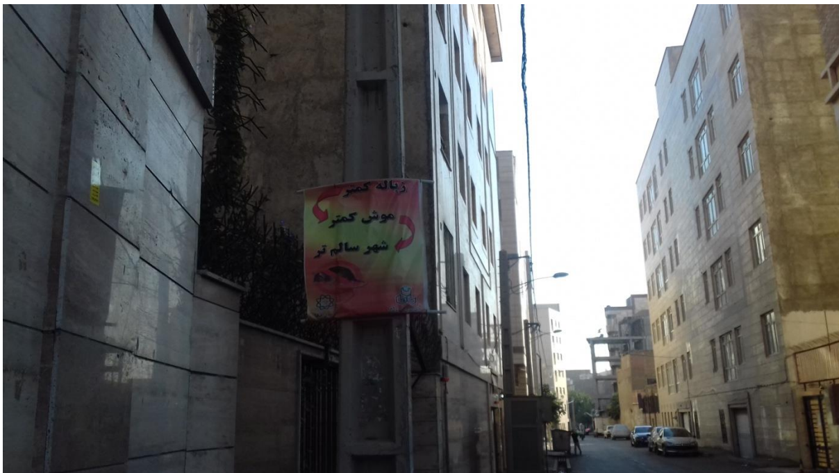
تصویر شماره 5: وجود حیوانات موذی در سطح محله

استراتژیکها و سیاستهایی که می‌توان در جهت از بین بردن مشکلات اجتماعی، کالبدی و زیست محیطی و... بکار برد تا عوامل تهدیدزا و عوامل خطر آفرین برای پیشگیری از آسیب اجتماعی در محله شاد آباد کاهش یابد، شامل موارد ذیل می‌باشد: